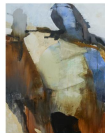
Pintura a Óleo | Mário João Rocha